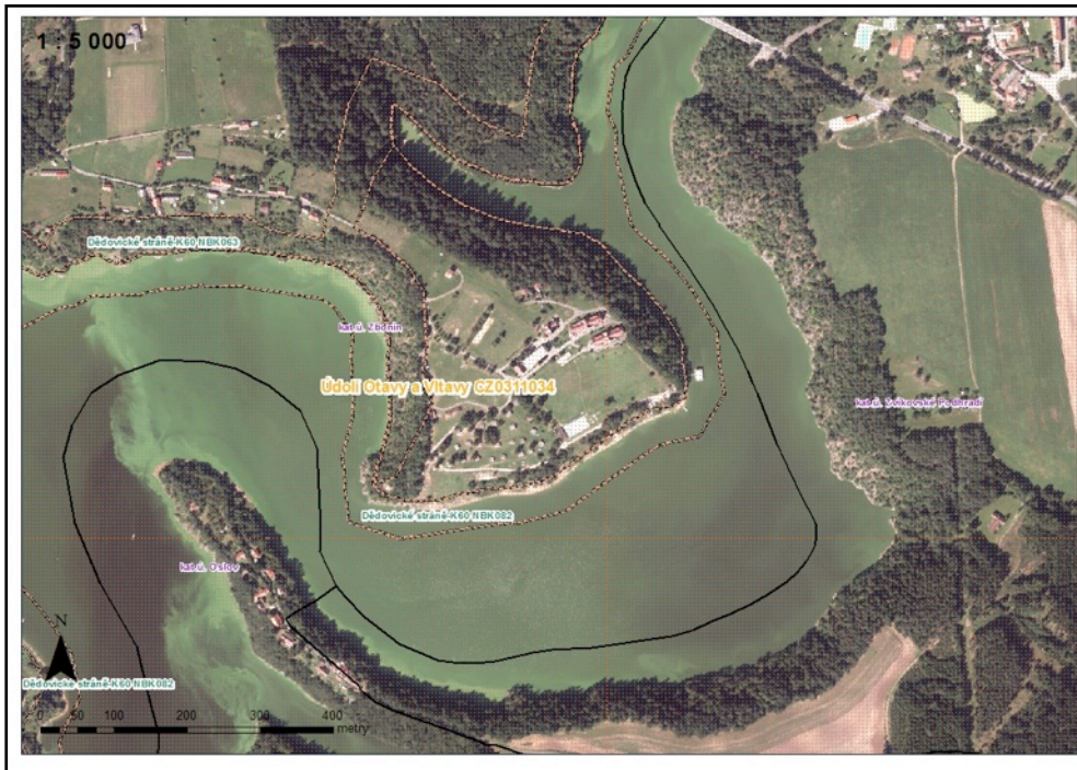
obr. č. 2 : Vymezený ÚSES v lokalitě