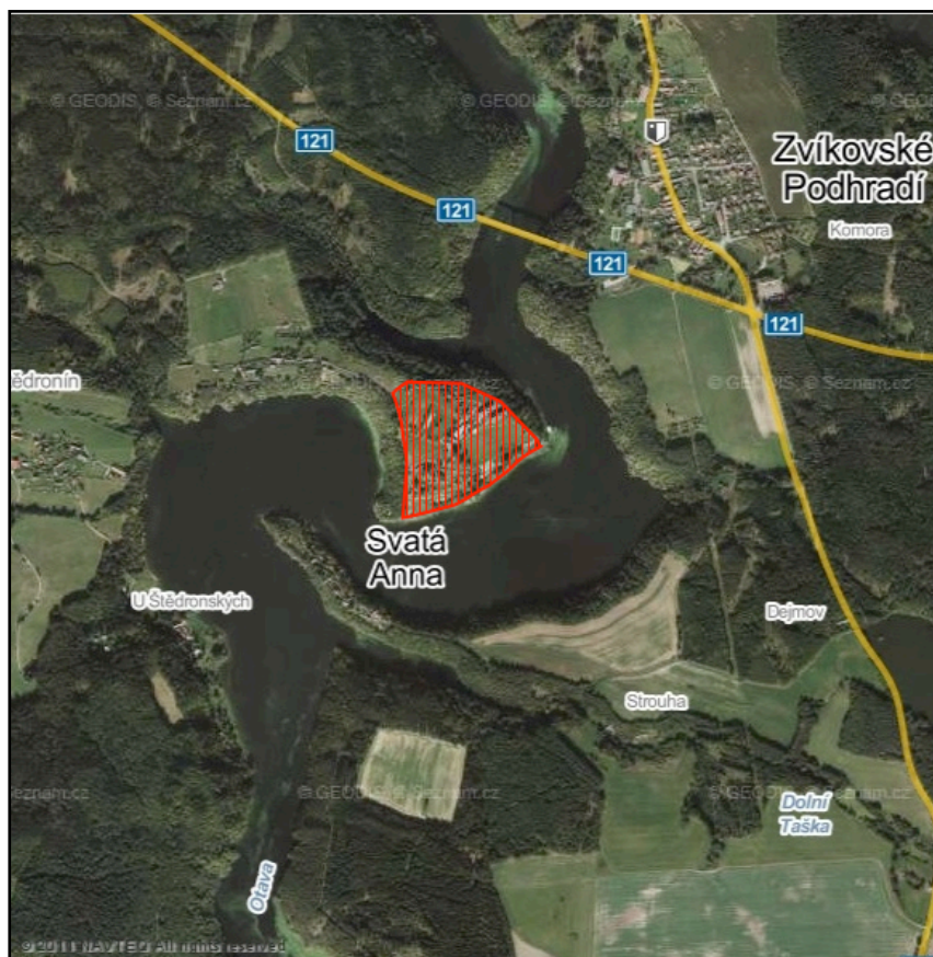
obr. č. 1: Orientační zakres záměru do ortofotomapy (podklad www.mapy.cz )