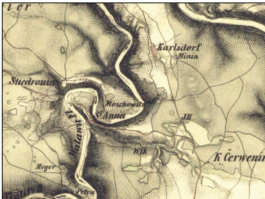
obr. č. 3 : snímek historického mapování 1836-1852 (II. Vojenské mapování - Františkovo)

Samotná lokalita záměru není významnější archeologickou lokalitou, nenachází ani v přímém kontaktu s archeologicky významnými místy a není územím s archeologickými nálezy.